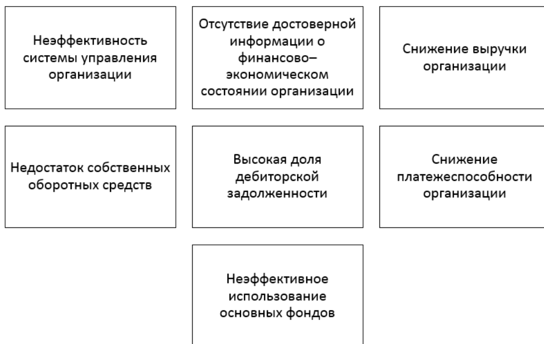
Рис. 3 – Актуальные проблемы, препятствующие повышению финансовой устойчивости предприятия.

Из рисунка 3 следует, что для современных организаций существует ряд проблем, препятствующих эффективному функционированию, повышению финансовой устойчивости и снижению вероятности банкротства организации. К таким проблемам следует отнести: