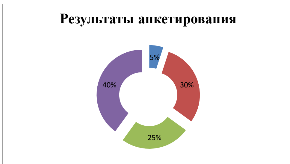
Рис. 2. Результаты проведенного опроса жителей и гостей города Сочи

Результаты опроса продемонстрированы на рисунке 2.